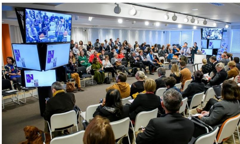
49 ème convention AMARC au sein d'Orange Campus, 10 octobre 2019

Ainsi Rosa Bonheur, artiste peintre, demande une inflexion de la Loi pour lui permettre de réaliser ses œuvres dans de meilleures conditions. De quoi transformer les pépins en pépites®, en toute symétrie des attentions®.